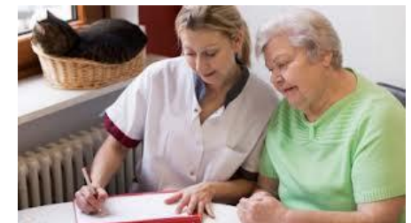
Professionele Zorg en ondersteuning